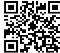
NPO法人 尾道総合型びんごスポーツクラブ HP